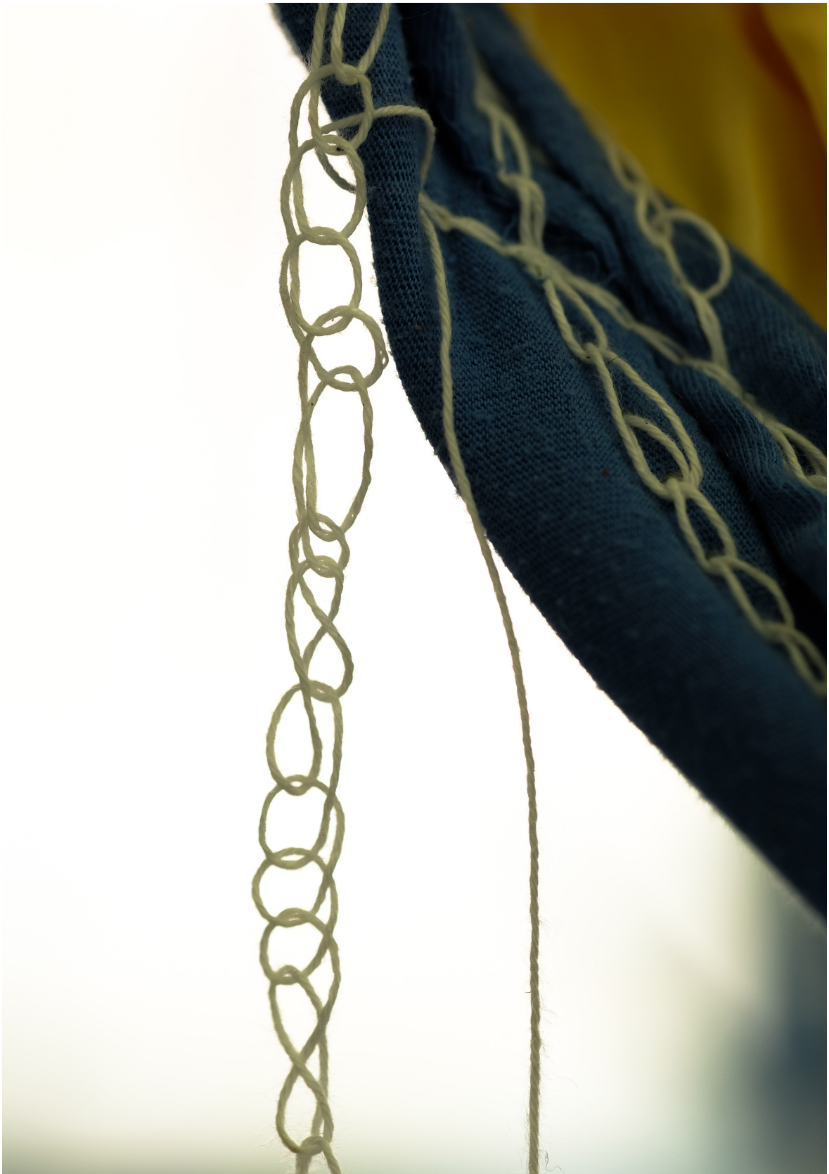
Julien Creuzet, Il pleut encore, des minis gouttelettes, elles marquent le temps et le vertige des arbres (...) (detail), 2019, CAN Centre d'art Neuchâtel.