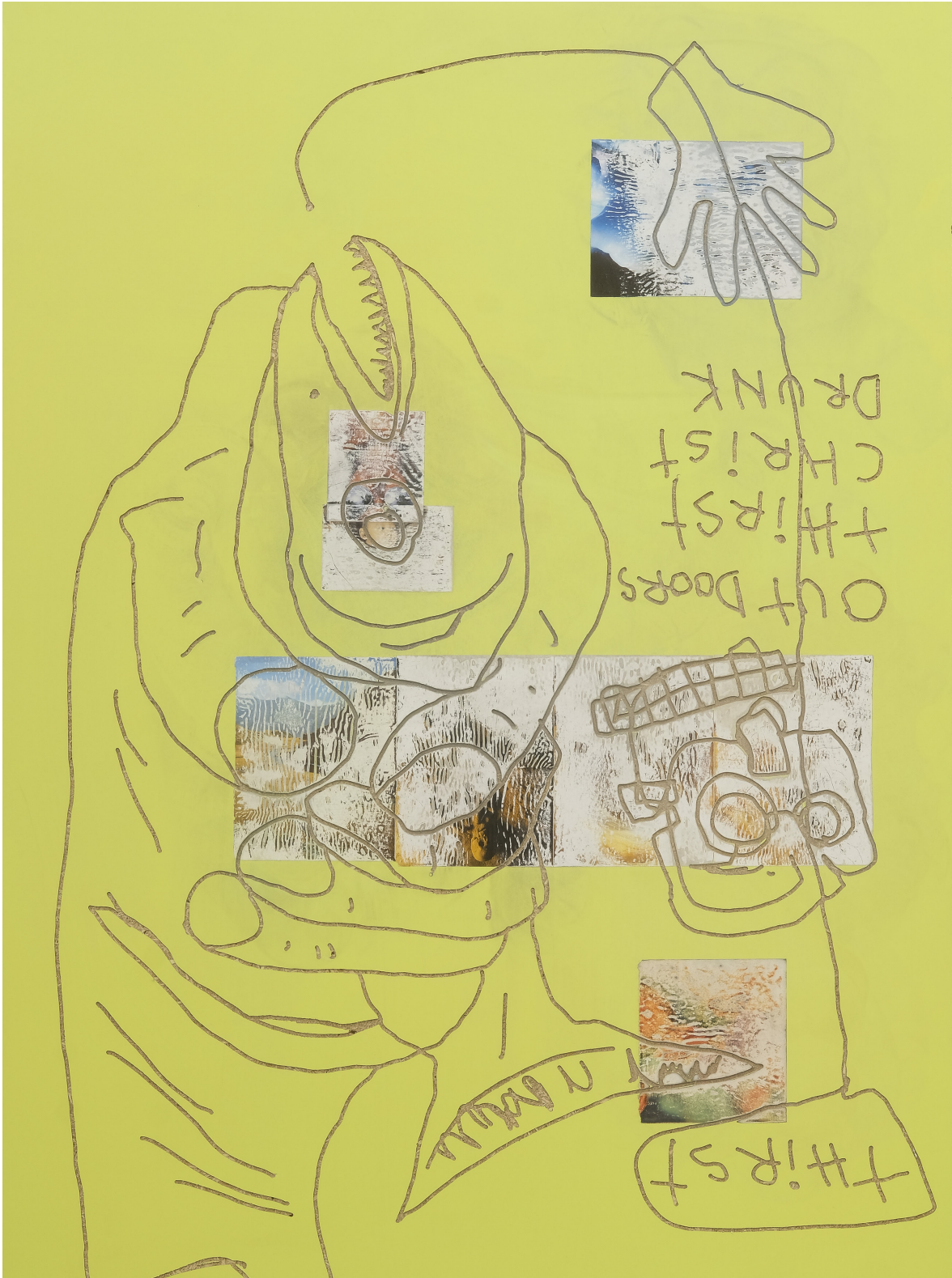
Julien Creuzet, Thirst, Outdoors, Thirst, Christ, Drunk , 2019, Mixed media, 190x140 cm.