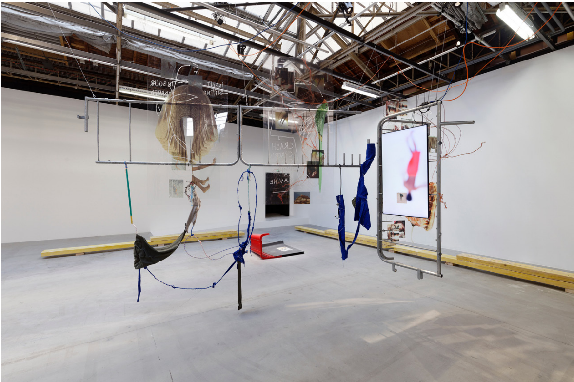
Julien Creuzet, « les lumières affaiblies des étoiles lointaines les lumières à LED des gyrophares se complaisent, lampadaire braise brûle les ailes, sacrifice fou du papillon de lumière, fantôme crépusculaire d'avant la naissance du monde (...) c'est l'étrange, j'ai dû partir trop longtemps le lointain, mon chez moi est dans mes rêves-noirs c'est l'étrange, des mots étranglés dans la noyade, j'ai hurlé seul dans l'eau, ma fièvre (...) », 2019, exhibition view, Palais de Toyko, Paris.