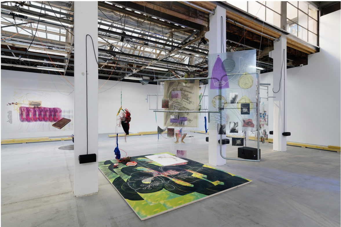
Julien Creuzet, « les lumières affaiblies des étoiles lointaines les lumières à LED des gyrophares se complaisent, lampadaire braise brûle les ailes, sacrifice fou du papillon de lumière, fantôme crépusculaire d'avant la naissance du monde (...) c'est l'étrange, j'ai dû partir trop longtemps le lointain, mon chez moi est dans mes rêves-noirs c'est l'étrange, des mots étranglés dans la noyade, j'ai hurlé seul dans l'eau, ma fièvre (...) », 2019, exhibition view, Palais de Toyko, Paris.