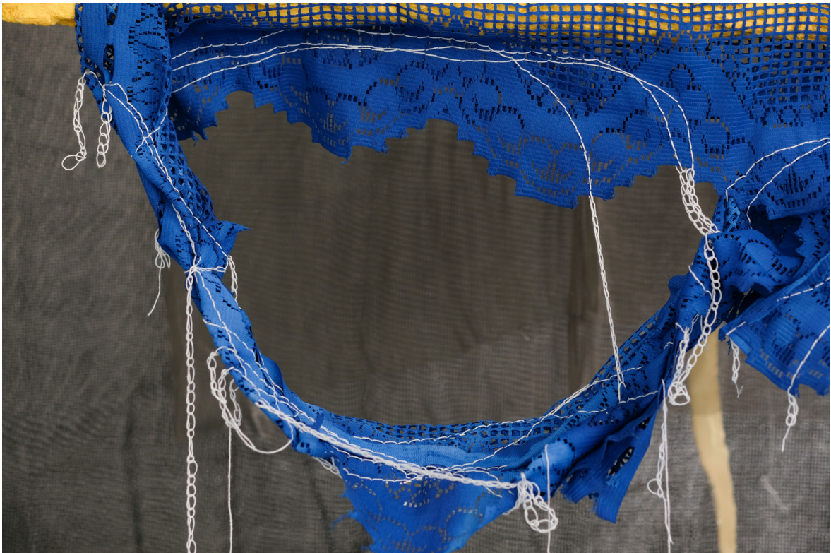
Julien Creuzet, Il pleut encore, des minis gouttelettes, elles marquent le temps et le vertige des arbres (...) (detail), 2019, CAN Centre d'art Neuchâtel.