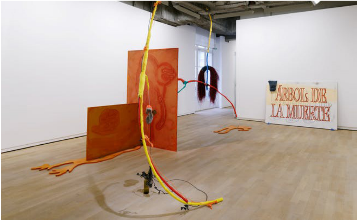
Julien Creuzet, Toute la distance de la mer, pour que les filaments à huile des mancenilliers nous arrêtent les battements de cœur. - La pluie a rendu cela possible (...) , 2018, exhibition view, La Fondation d'entreprise Ricard, Paris.