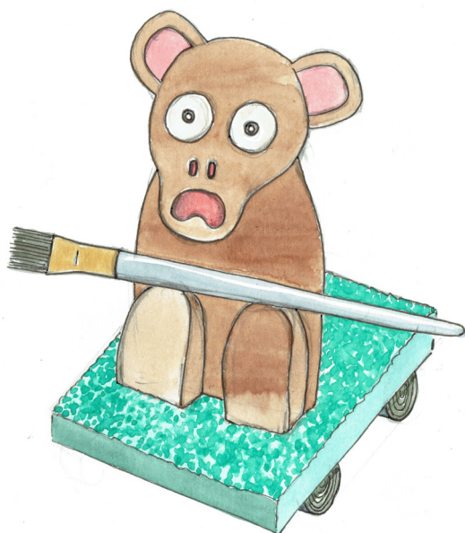
I Represented Myself as a Hybrid Painter with a Big Brush and No Arms, Série My Life as a Parade , dessin, 2017

Couverture : EX CORDE CARITAS , vidéo, 2017