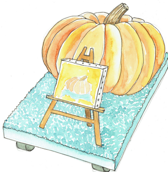
My First Painting on Canvas, Série My Life as a Parade , dessin, 2017