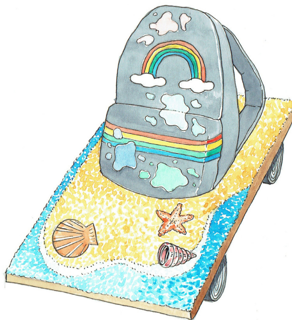
An Early Kind of Painting, Série My Life as a Parade , dessin, 2017

Couverture : EX CORDE CARITAS , vidéo, 2017